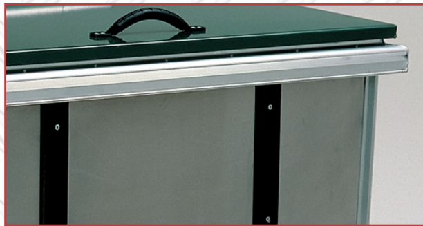
Plastlister i front for beskyttelse ved tømning.