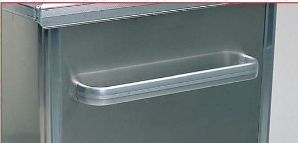
Kan leveres med solide aluminiumshåndtak på sidene.