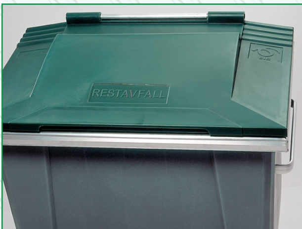
Lokk kan leveres med egen logo.