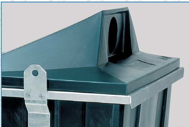
Innkast for glass, som vist her, eller papir.